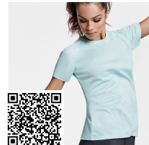
BAHRAIN WOMAN CA0408