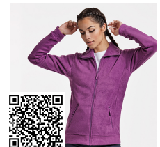
PIRINEO WOMAN CQ1091