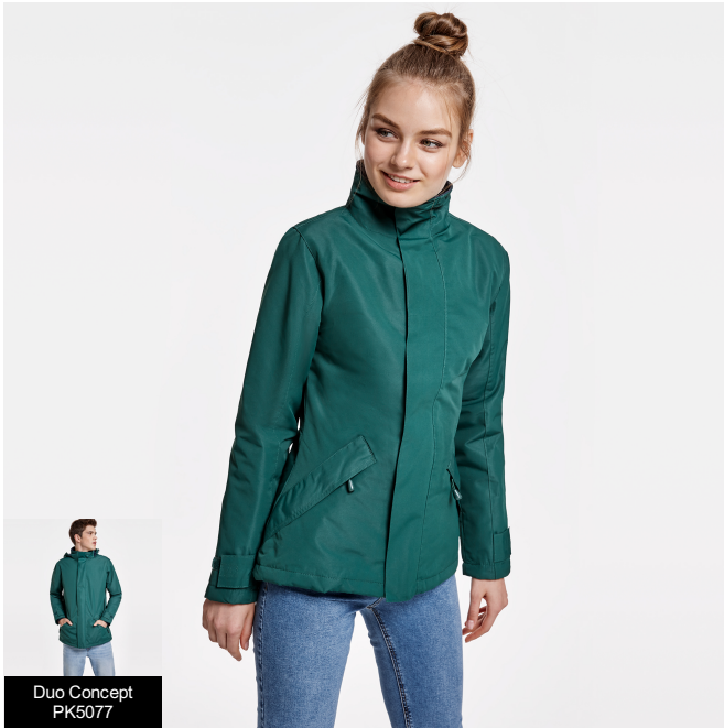
Duo Concept PK5077